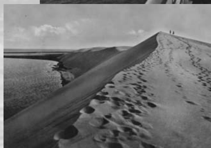
Sanddünen an der Kurischen Nehrung